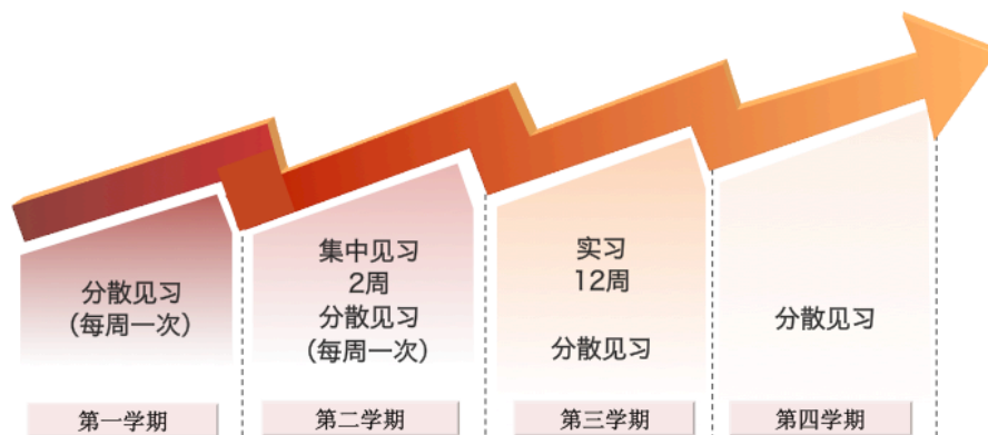
图 1 全日制教育硕士培养贯通式实践课程

实践课程在时间上实现贯通。见习和实习活动持续发生于整个学习过程中，在浸入式的实践课程学习中，全日制教育硕士及时纪录并整理听课笔记，进行教学反思，双导师及时进行反馈评价，有效促进了全日制教育硕士的反思与积淀；实践课程在课程空间上实现贯通，我校建设的教师发展学校覆盖北京市城区与郊区、城镇与乡村，每一位全日制教育硕士的集中见习和实习会进入不同类型的学校，感受丰富的教育现实，全面了解学校教育的发生，更好地理解教师的专业生活；在学、教、研的协调统一中实现贯通，全日制教育硕士在真实的教育情境中理解教育理论，用理论分析教育现象，从实践场域中提炼教育问题，以学习者、实践者、研究者的身份进行深入的思考，为解决教育问题寻找理论依据和实践证据，使理论学习、教育实践、教育研究三者自然、实在地融为一体。